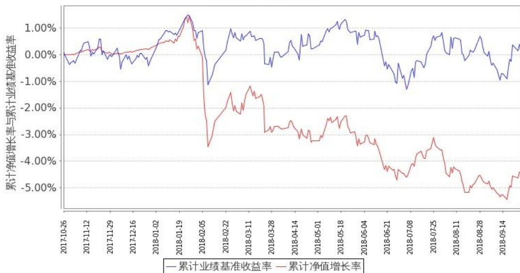
图 2：嘉实领航资产配置混合（FOF）C 基金累计份额净值增长率与同期业绩比较基准收益率的历史走势对比图