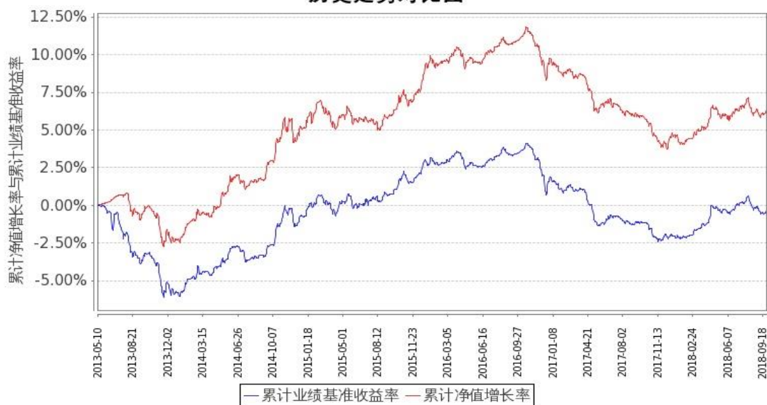
图1：嘉实中证金边中期国债ETF联接A基金份额累计净值增长率与同期业绩比较基准收益率的历史走势对比图 (2013年5月10日至2018年9月30日)