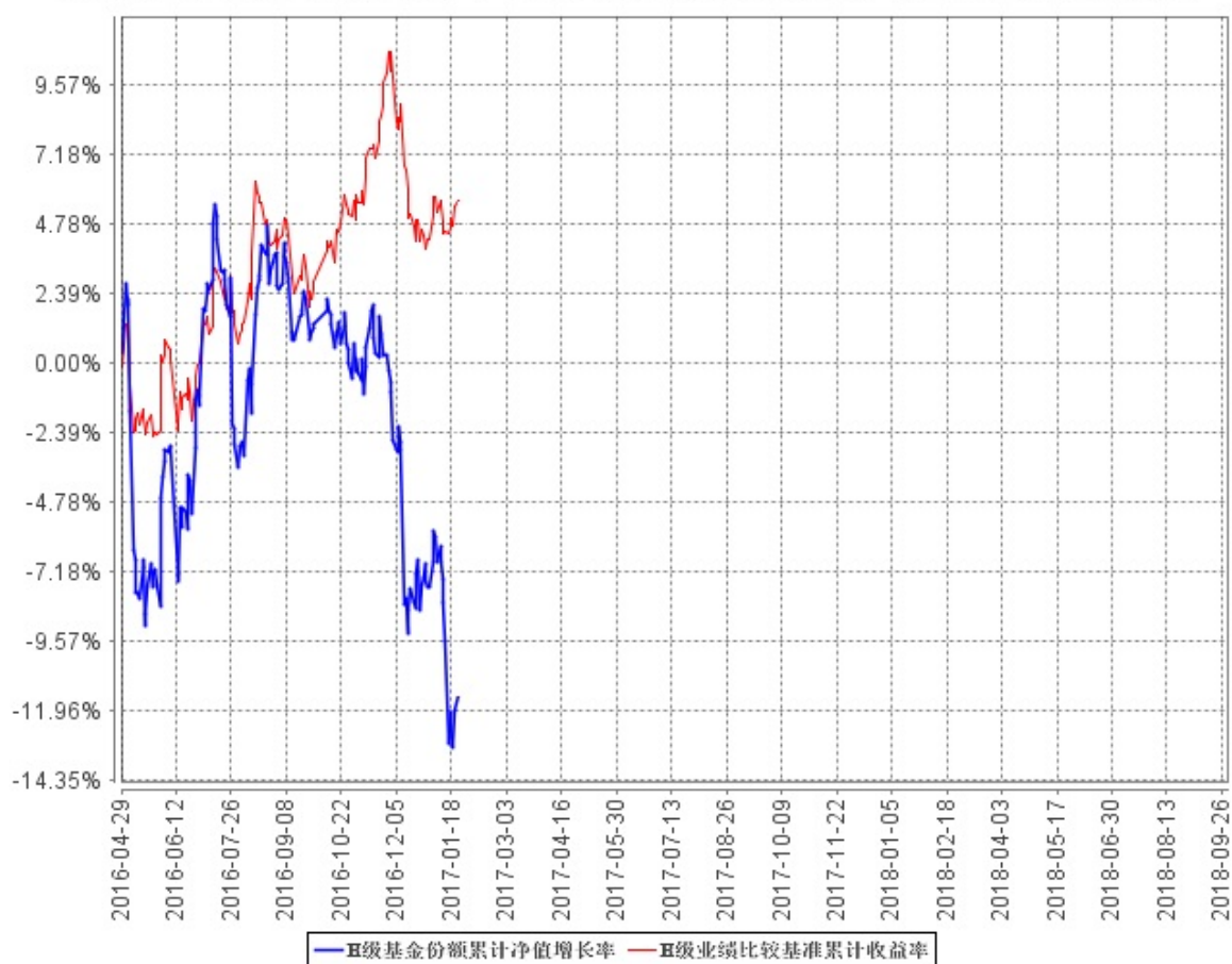
H级基金份额累计净值增长率与同期业绩比较基准收益率的历史走势对比图