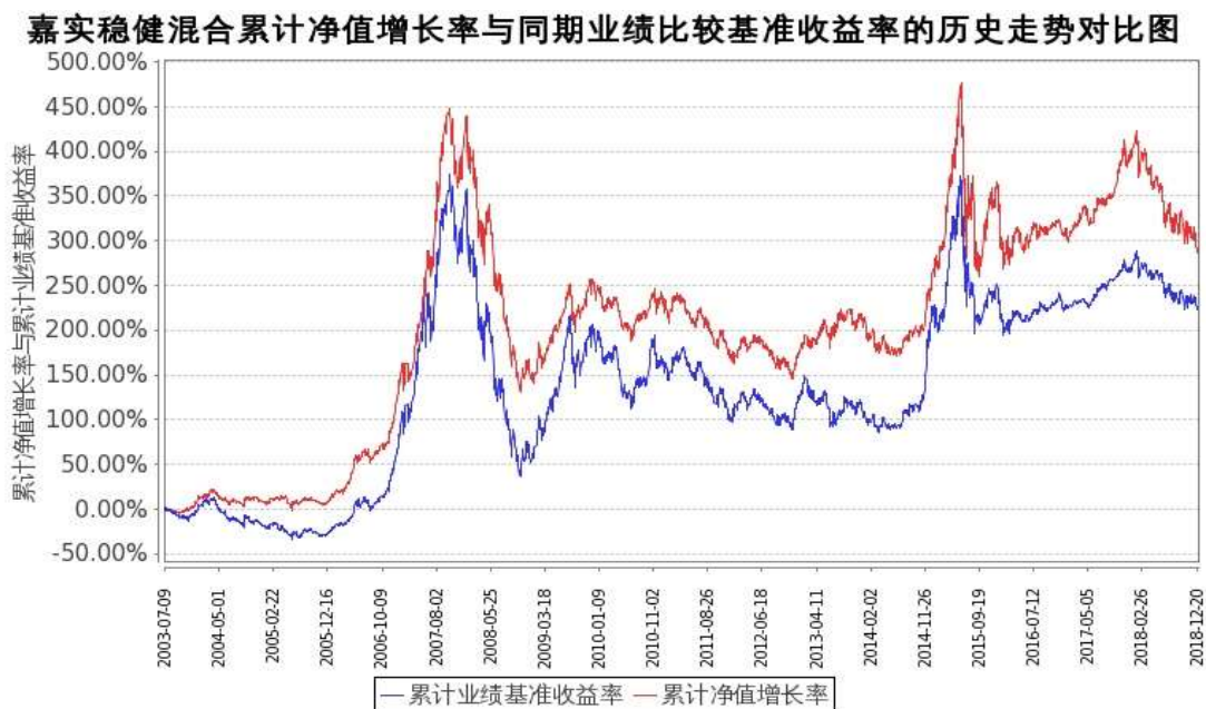
图：嘉实稳健混合份额累计净值增长率与同期业绩比较基准收益率的历史走势对比图