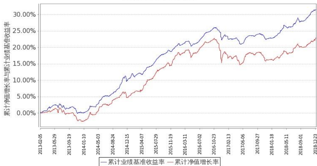
图2：嘉实中证中期企业债指数（LOF）C基金份额累计净值增长率与同期业绩比较基准收益率的历史走势对比图