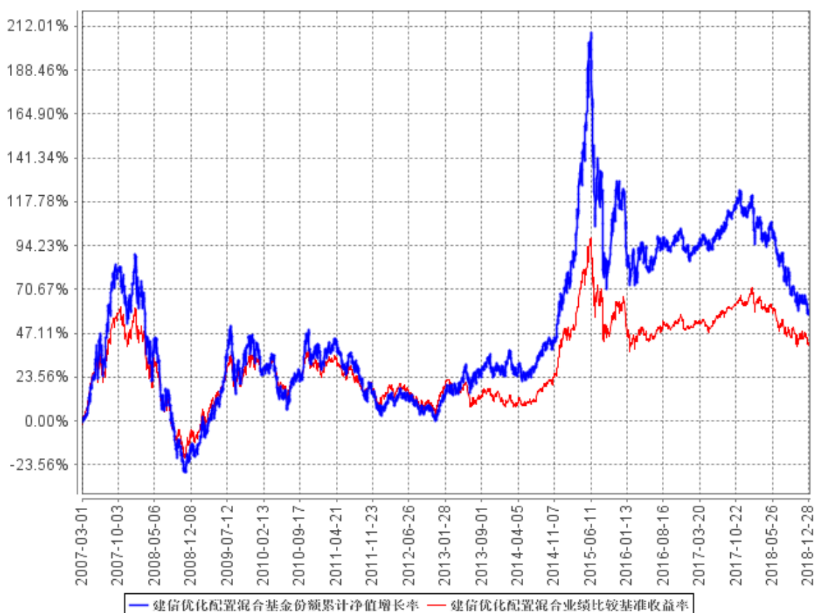
建信优化配置混合基金份额累计净值增长率与同期业绩比较基准收益率的历史走势对比图