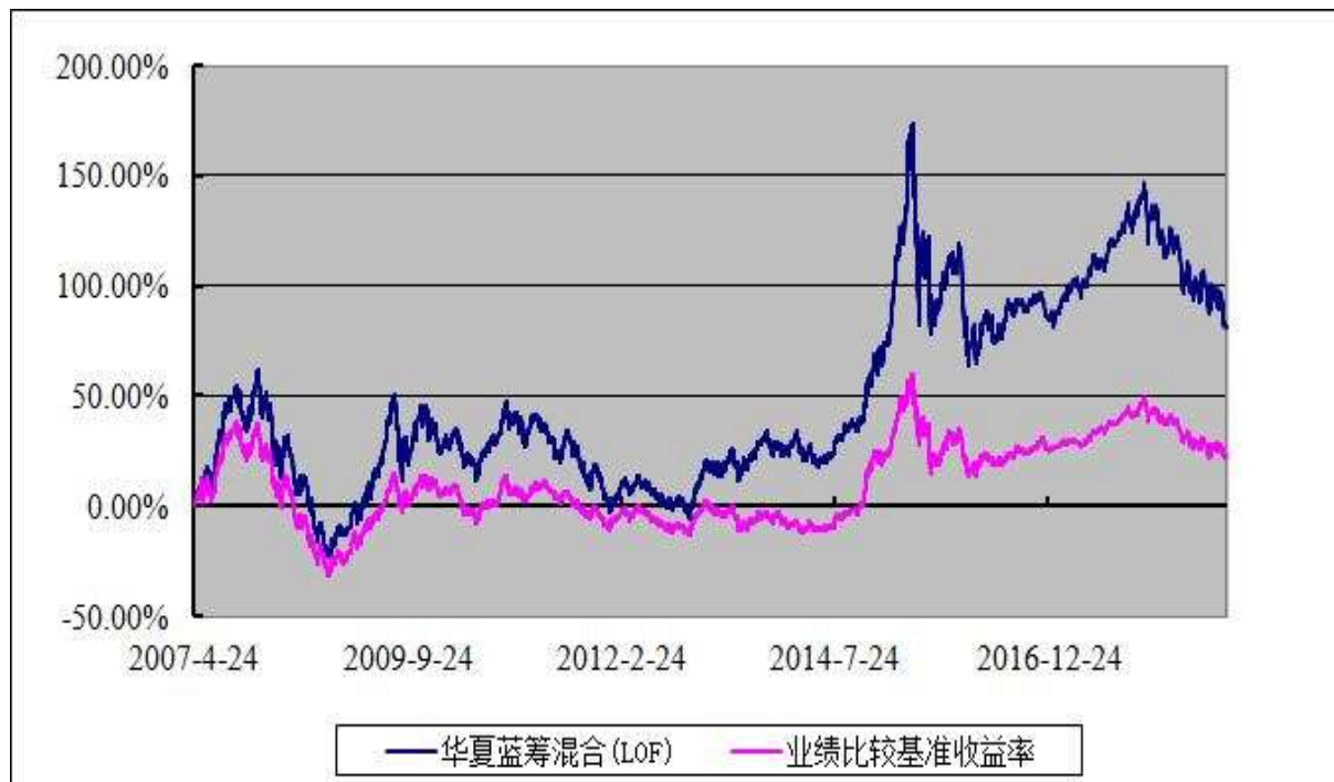
基金份额累计净值增长率与业绩比较基准收益率的历史走势对比图 (2007 年 4 月 24 日至 2018 年 12 月 31 日)

注：自 2007 年 4 月 24 日起，由《兴科证券投资基金基金合同》修订而成的《华夏蓝筹核心混合型证券投资基金(LOF)基金合同》生效。