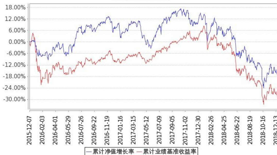
图：嘉实腾讯自选股大数据策略股票基金份额累计净值增长率与同期业绩比较基准收益率的历史走势对比图