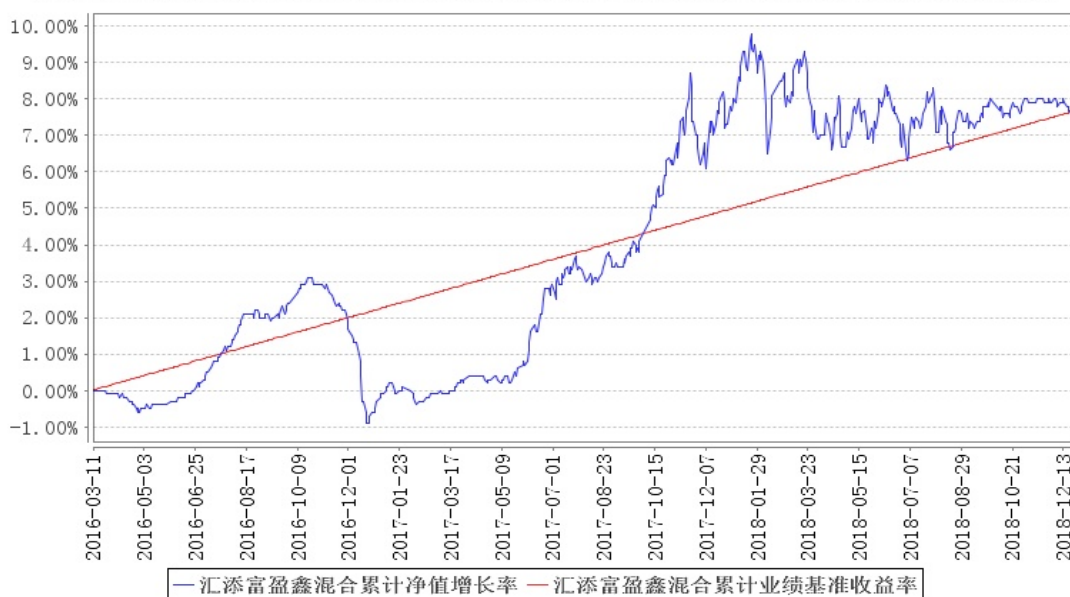
汇添富盈鑫混合累计净值增长率与同期业绩比较基准收益率的历史走势对比图

注:本基金建仓期为本《基金合同》生效之日(2016年3月11日)起6个月,建仓期结束时各项资产配置比例符合合同规定。