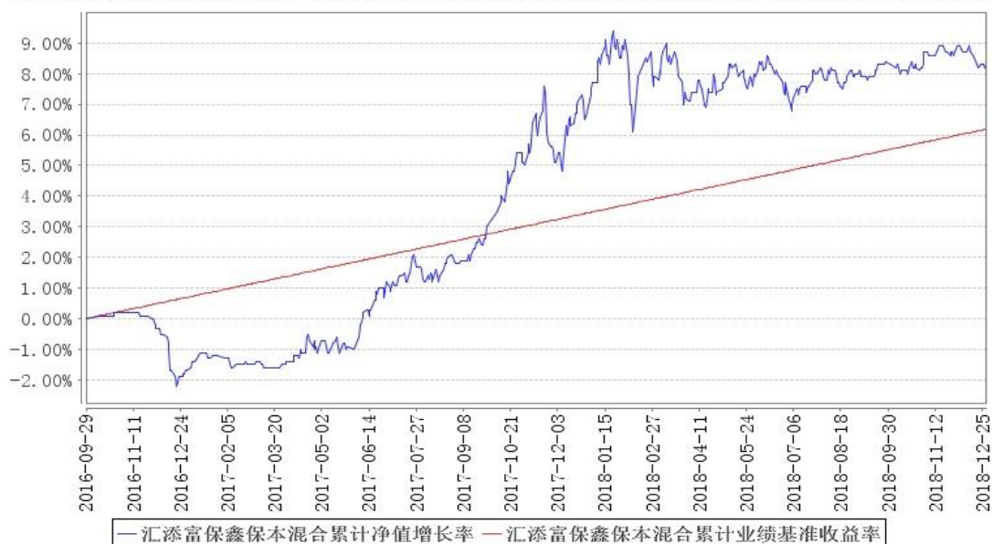
汇添富保鑫保本混合累计净值增长率与同期业绩比较基准收益率的历史走势对比图

注:本基金建仓期为本《基金合同》生效之日(2016年9月29日)起6个月,建仓期结束时各项资产配置比例符合合同规定。