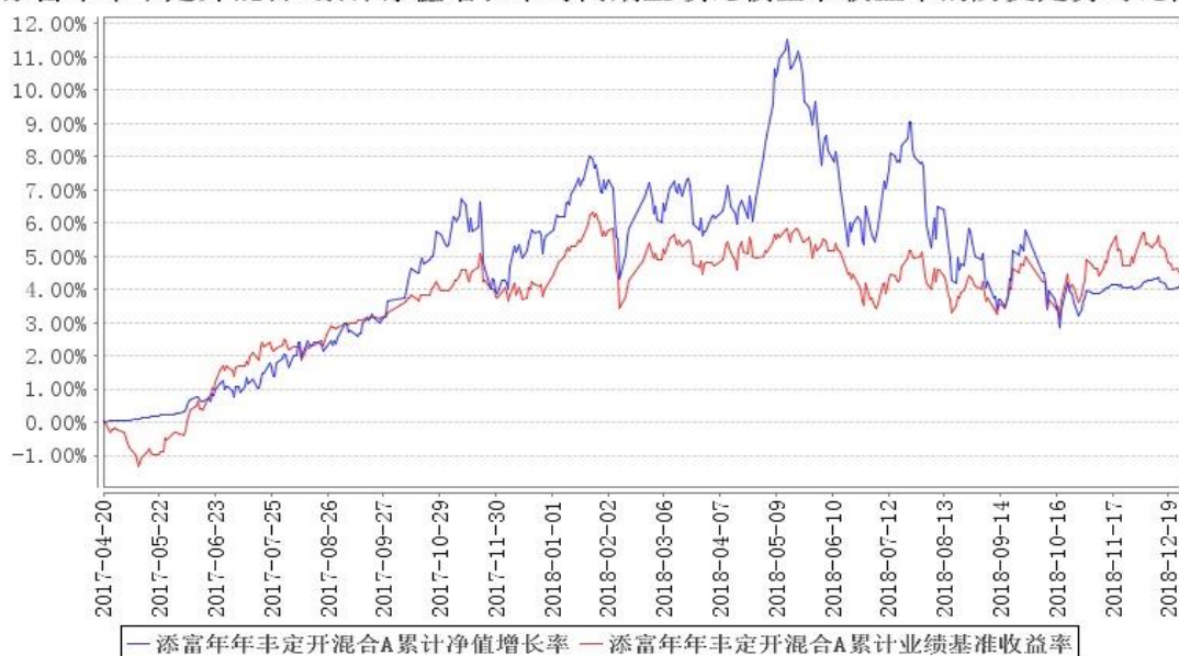
添富年年丰定开混合A累计净值增长率与同期业绩比较基准收益率的历史走势对比图