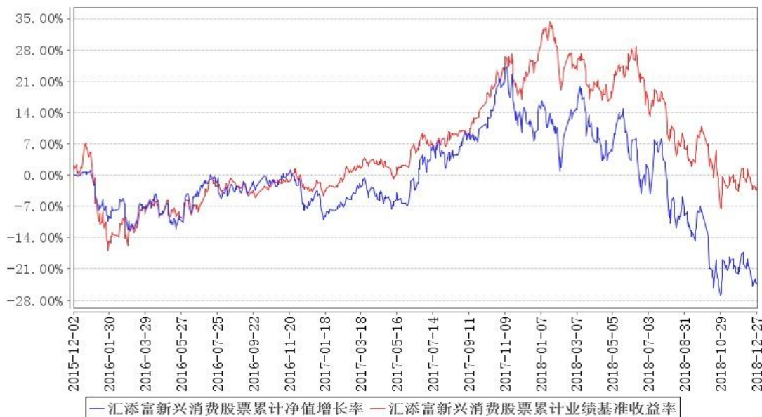
汇添富新兴消费股票累计净值增长率与同期业绩比较基准收益率的历史走势对比图

注:本基金建仓期为本《基金合同》生效之日(2015年12月02日)起6个月,建仓期结束时各项资产配置比例符合合同规定。