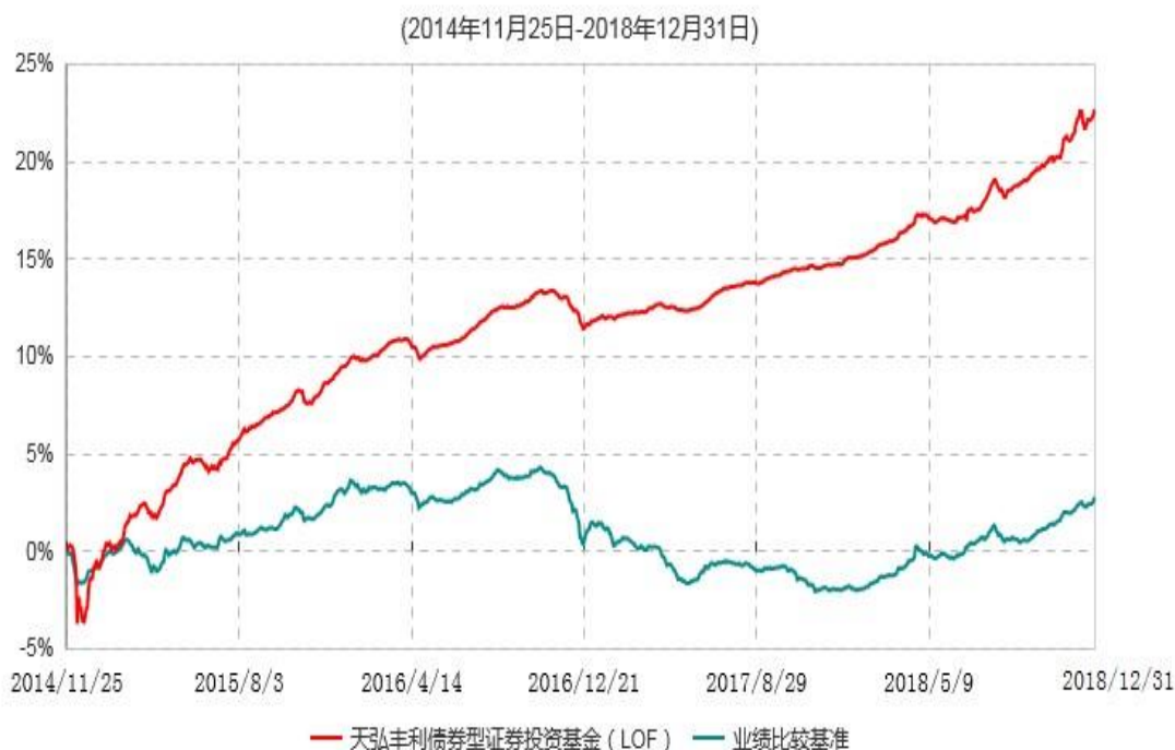
天弘丰利债券型证券投资基金（LOF）累计净值增长率与业绩比较基准收益率历史走势对比图