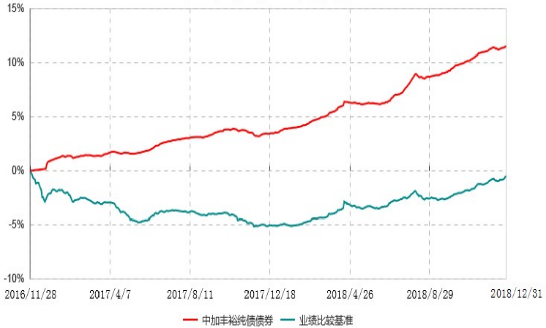
中加丰裕纯债债券型证券投资基金累计净值增长率与业绩比较基准收益率历史走势对比图 (2016年11月28日-2018年12月31日)