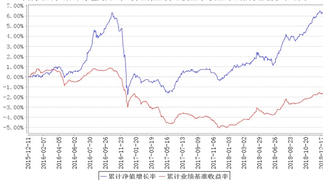
南方弘利A累计净值增长率与同期业绩比较基准收益率的历史走势对比图