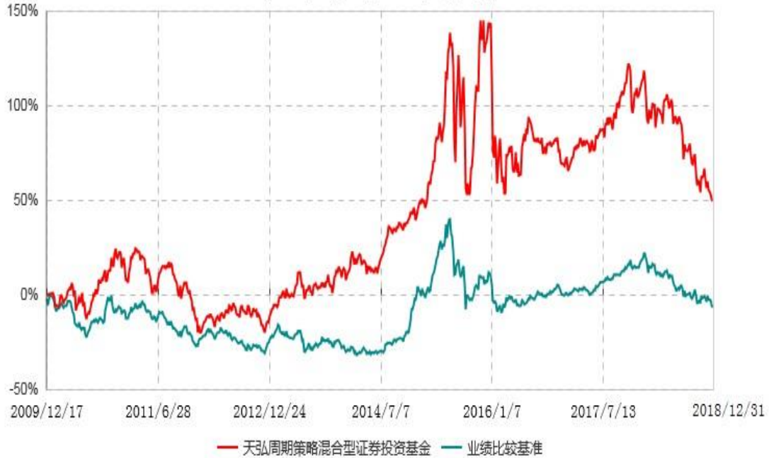
天弘周期策略混合型证券投资基金累计净值增长率与业绩比较基准收益率历史走势对比图 (2009年12月17日-2018年12月31日)