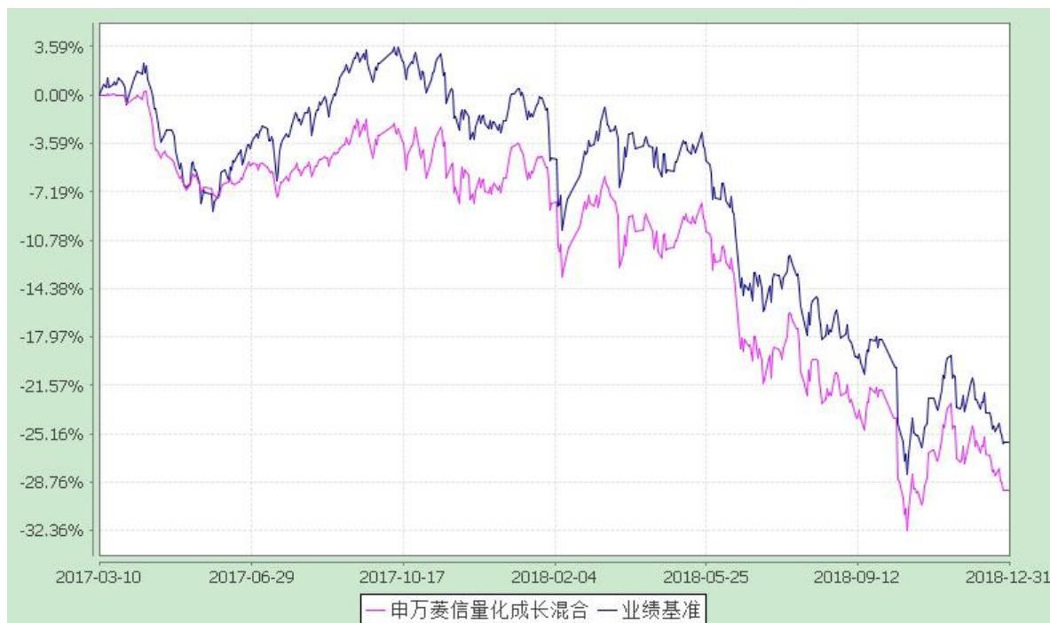
自基金合同生效以来份额累计净值增长率与业绩比较基准收益率的历史走势对比图 (2017 年 3 月 10 日至 2018 年 12 月 31 日)