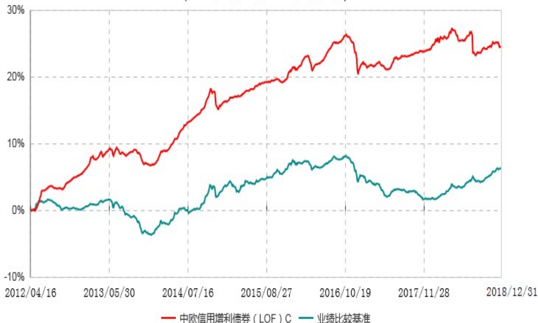
中欧信用增利债券 ( LOF ) E 累计净值增长率与业绩比较基准收益率历史走势对比图