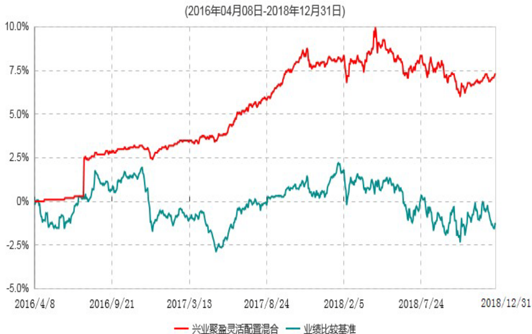
兴业聚盈灵活配置混合型证券投资基金累计净值增长率与业绩比较基准收益率历史走势对比图