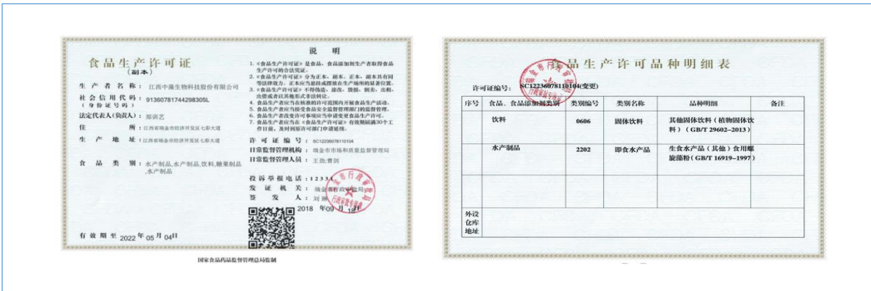
2018 年 9 月 获得“固体饮料、即食水产品（食用螺旋藻粉）”食品生产许可证