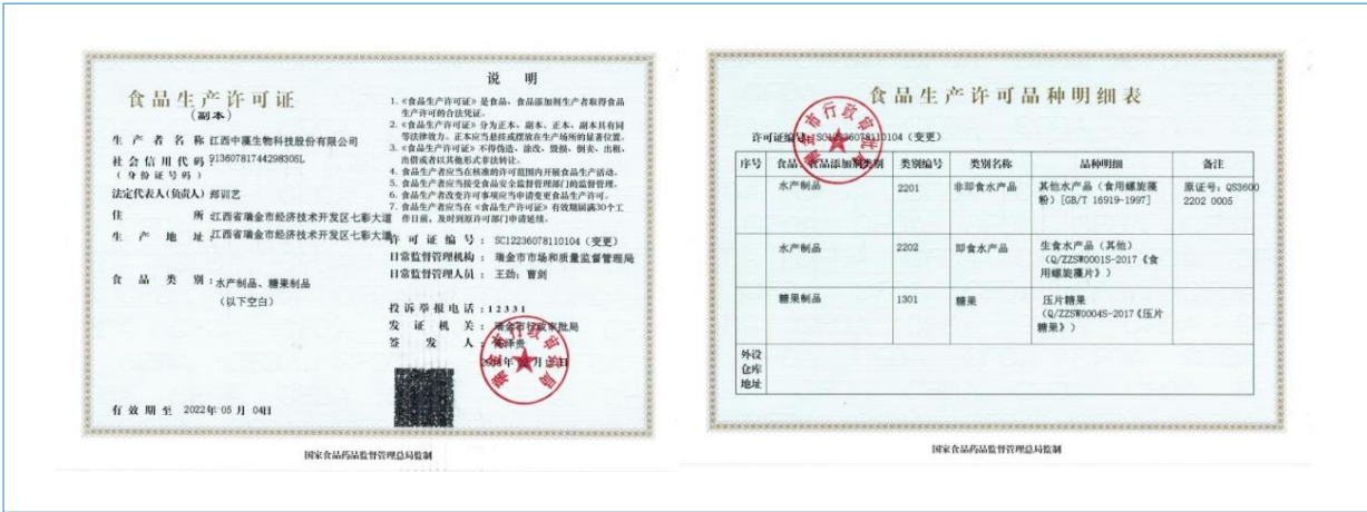
2018 年 2 月 获得“生食水产品（食用螺旋藻片）、压片糖果”食品生产许可证