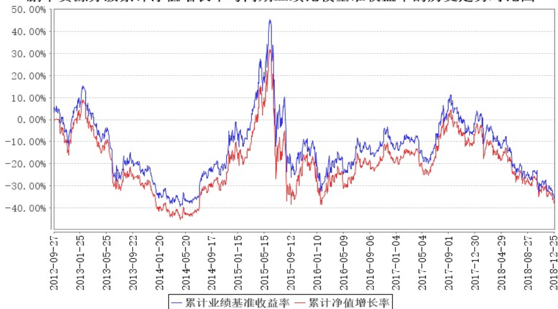
鹏华资源分级累计净值增长率与同期业绩比较基准收益率的历史走势对比图