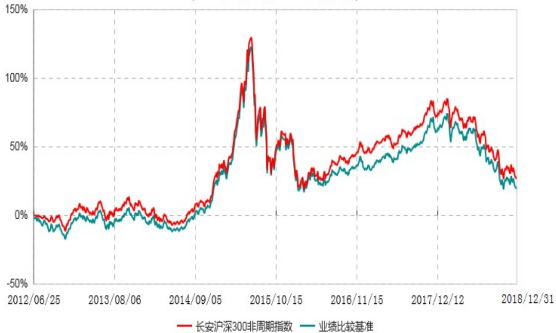
长安沪深300非周期行业指数证券投资基金累计净值增长率与业绩比较基准收益率历史走势对比图 (2012年06月25日-2018年12月31日)

根据基金合同的规定,自基金合同生效之日起6个月内基金各项资产配置比例需符合基金合同要求。本基金在建仓期结束后,各项资产配置比例已符合基金合同有关投资比例的约定。图示日期为2012年6月25日至2018年12月31日。