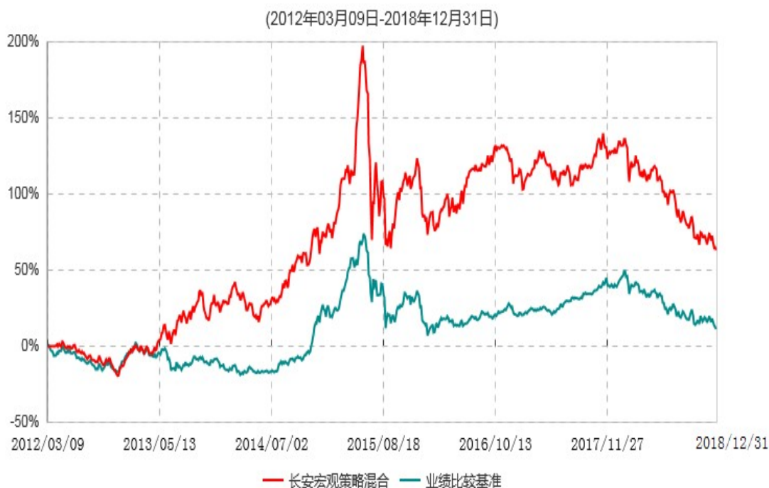
长安宏观策略混合型证券投资基金累计净值增长率与业绩比较基准收益率历史走势对比图

根据基金合同的规定,自基金合同生效之日起6个月内基金各项资产配置比例需符合基金合同要求。本基金在建仓期结束后,各项资产配置比例已符合基金合同有关投资比例的约定。图示日期为2012年3月9日至2018年12月31日。