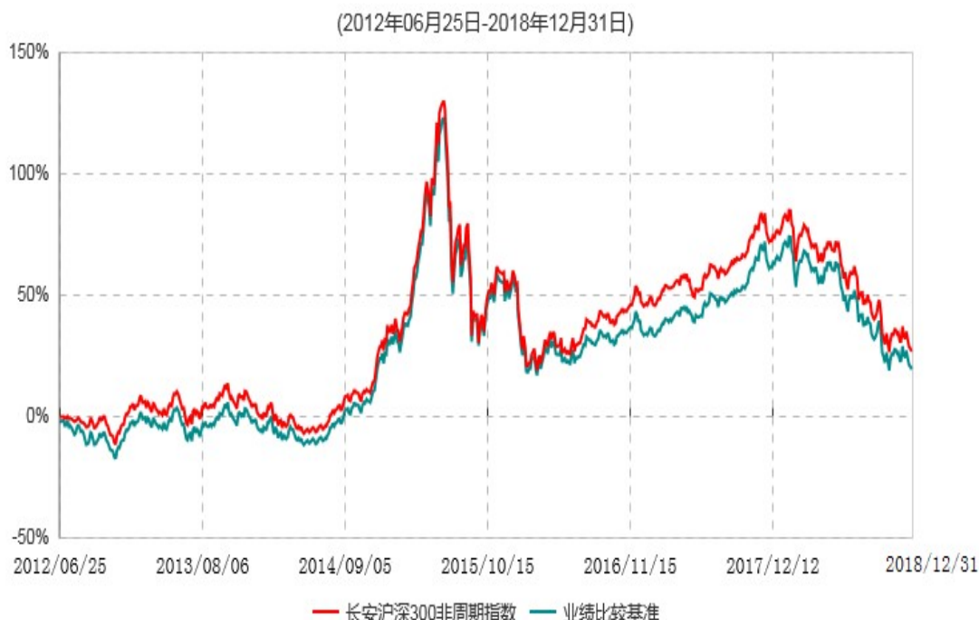
长安沪深300非周期行业指数证券投资基金累计净值增长率与业绩比较基准收益率历史走势对比图

根据基金合同的规定,自基金合同生效之日起6个月内基金各项资产配置比例需符合基金合同要求。本基金在建仓期结束后,各项资产配置比例已符合基金合同有关投资比例的约定。图示日期为2012年6月25日至2018年12月31日。