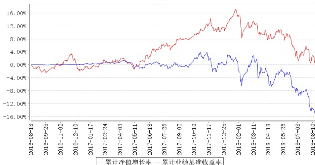
大成多策略混合 (LOF) 累计净值增长率与同期业绩比较基准收益率的历史走势对比图

注:按基金合同规定,基金管理人应当自基金合同生效之日起6个月内使基金的投资组合比例符合基金合同的约定,截至本基金转型前,本基金投资顺丰控股(002352)因定增股票估值方式变更,导致单个股票的投资比例被动超标。除此之外,报告期内本基金的其他各项投资比例符合基