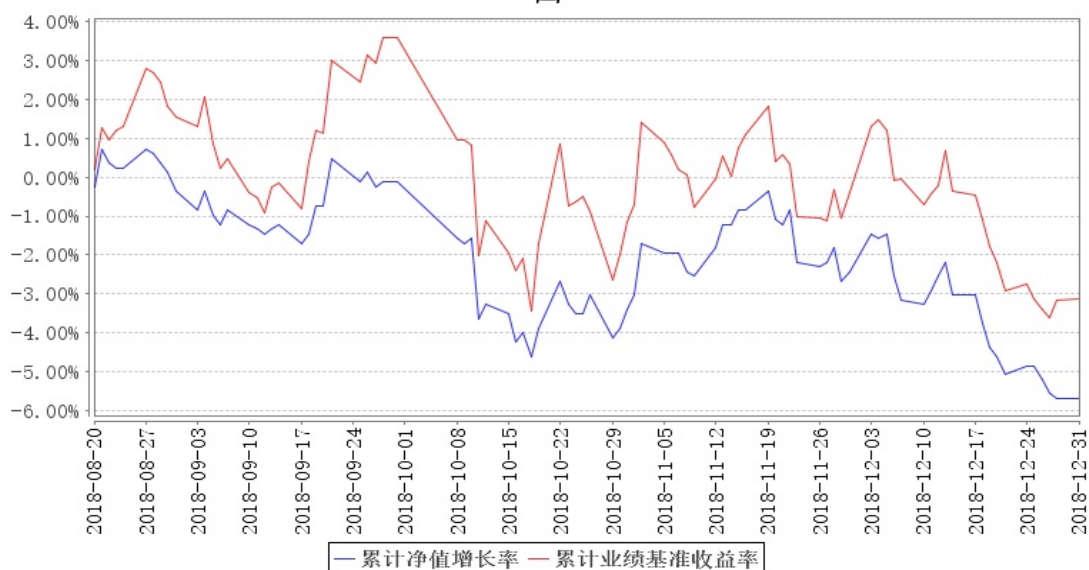
大成多策略混合 (LOF) 累计净值增长率与同期业绩比较基准收益率的历史走势对比图

注:1. 本基金自 2018 年 8 月 18 日起, 由大成定增灵活配置混合型证券投资基金转换为上市开放式基金 (LOF), 基金名称变更为“大成多策略灵活配置混合型证券投资基金 (LOF)”, 截至报告期末本基金转型未满一年。