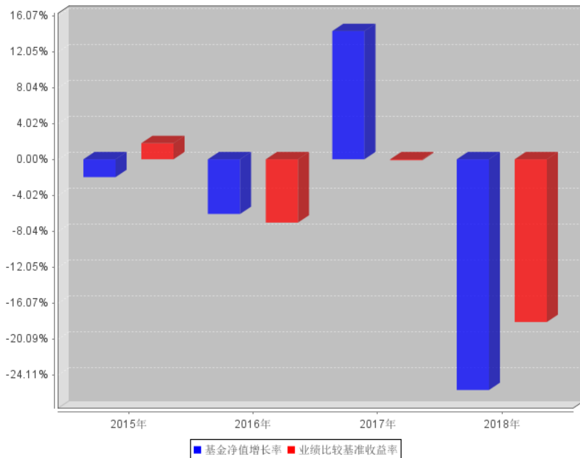
自基金合同生效以来基金每年净值增长率及其与同期业绩比较基准收益率的对比图