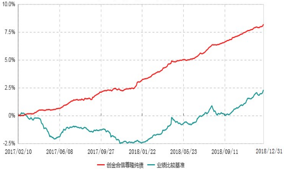
创金合信尊隆纯债债券型证券投资基金累计净值增长率与业绩比较基准收益率历史走势对比图 (2017年02月10日-2018年12月31日)