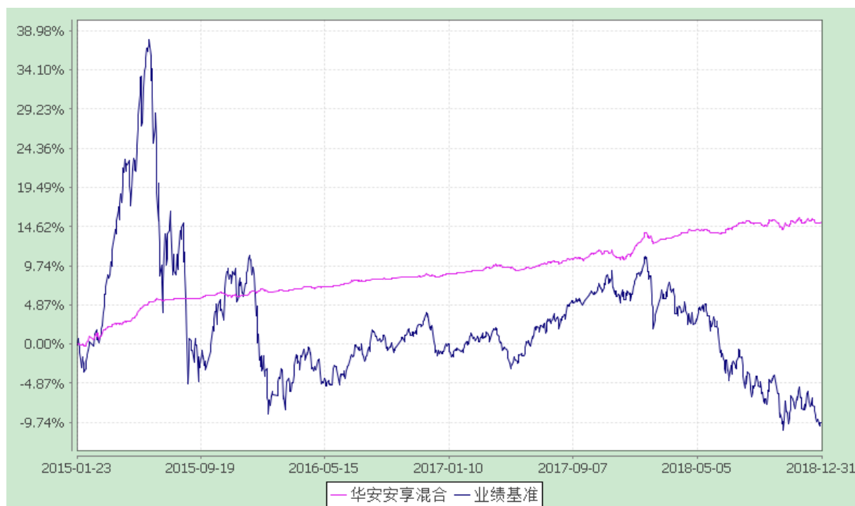
华安安享灵活配置混合型证券投资基金 份额累计净值增长率与业绩比较基准收益率的历史走势对比图 (2015 年 1 月 23 日至 2018 年 12 月 31 日)