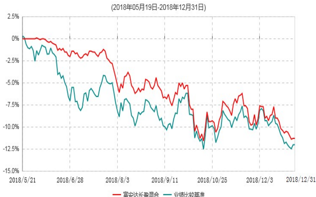
富安达长盈灵活配置混合型证券投资基金累计净值增长率与业绩比较基准收益率历史走势对比图

1、本基金由富安达长盈保本混合型证券投资基金转型而来并于2018年5月19日合同生效，上图报告期间的起始日为2018年5月19日，截止本报告期末本基金转型合同生效未满一年。