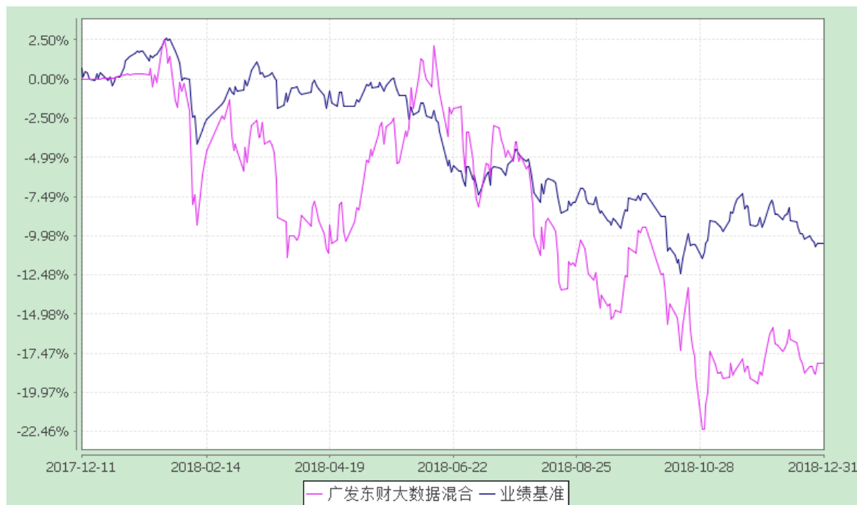
广发东财大数据精选灵活配置混合型证券投资基金 份额累计净值增长率与业绩比较基准收益率的历史走势对比图 (2017 年 12 月 11 日至 2018 年 12 月 31 日)

注：本基金建仓期为基金合同生效后 6 个月，建仓期结束时各项资产配置比例符合本基金合同有关规定。