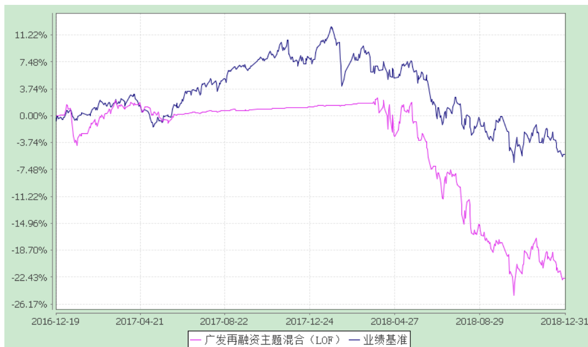
广发再融资主题灵活配置混合型证券投资基金（LOF） 份额累计净值增长率与业绩比较基准收益率的历史走势对比图 (2016 年 12 月 19 日至 2018 年 12 月 31 日)

注：自 2018 年 3 月 29 日起（含该日），本基金基金名称由“广发睿吉定增主题灵活配置混合型证券投资基金”变更为“广发再融资主题灵活配置混合型证券投资基金（LOF）”，并正式转为上市开放式基金（LOF）。