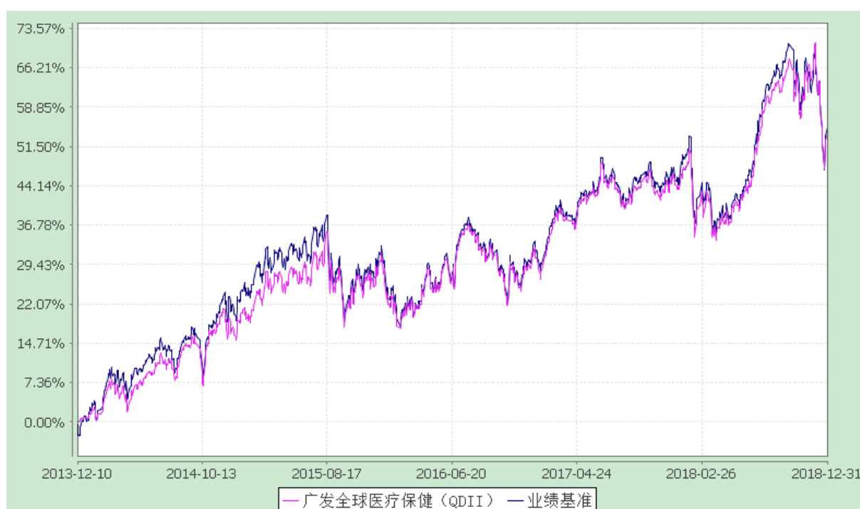
广发全球医疗保健指数证券投资基金 份额累计净值增长率与业绩比较基准收益率历史走势对比图 (2013 年 12 月 10 日至 2018 年 12 月 31 日)