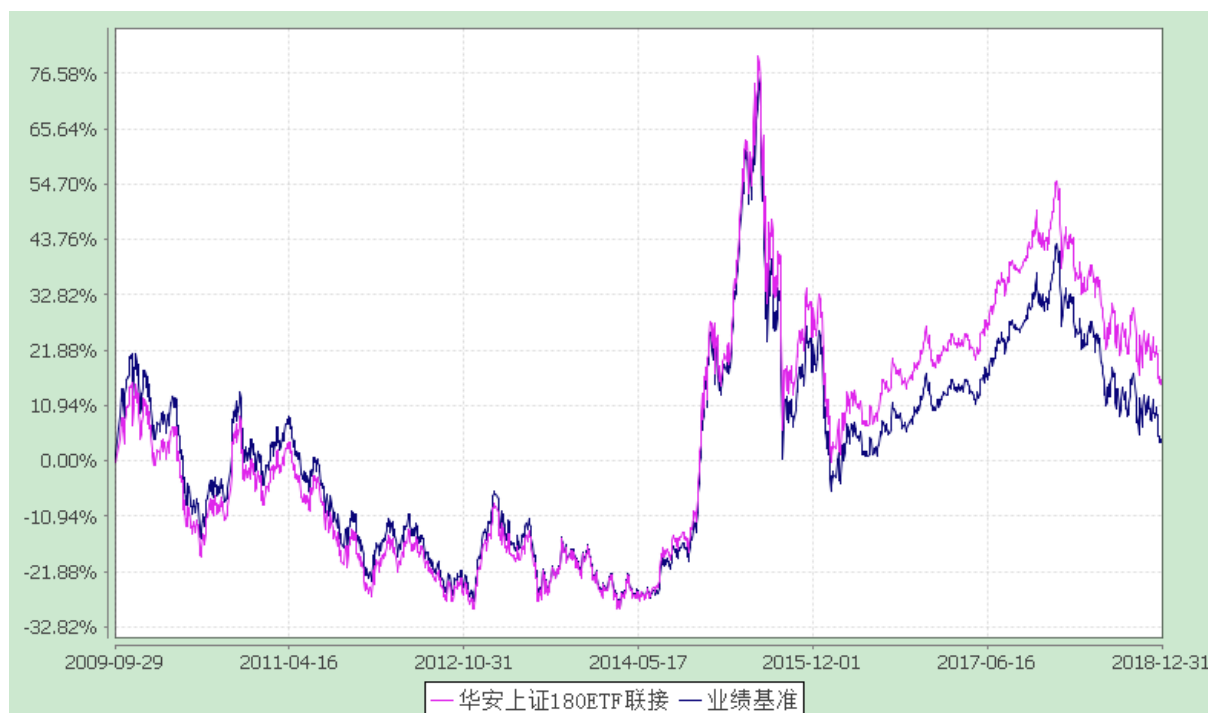
华安上证 180 交易型开放式指数证券投资基金联接基金 份额累计净值增长率与业绩比较基准收益率的历史走势对比图 (2009 年 9 月 29 日至 2018 年 12 月 31 日)