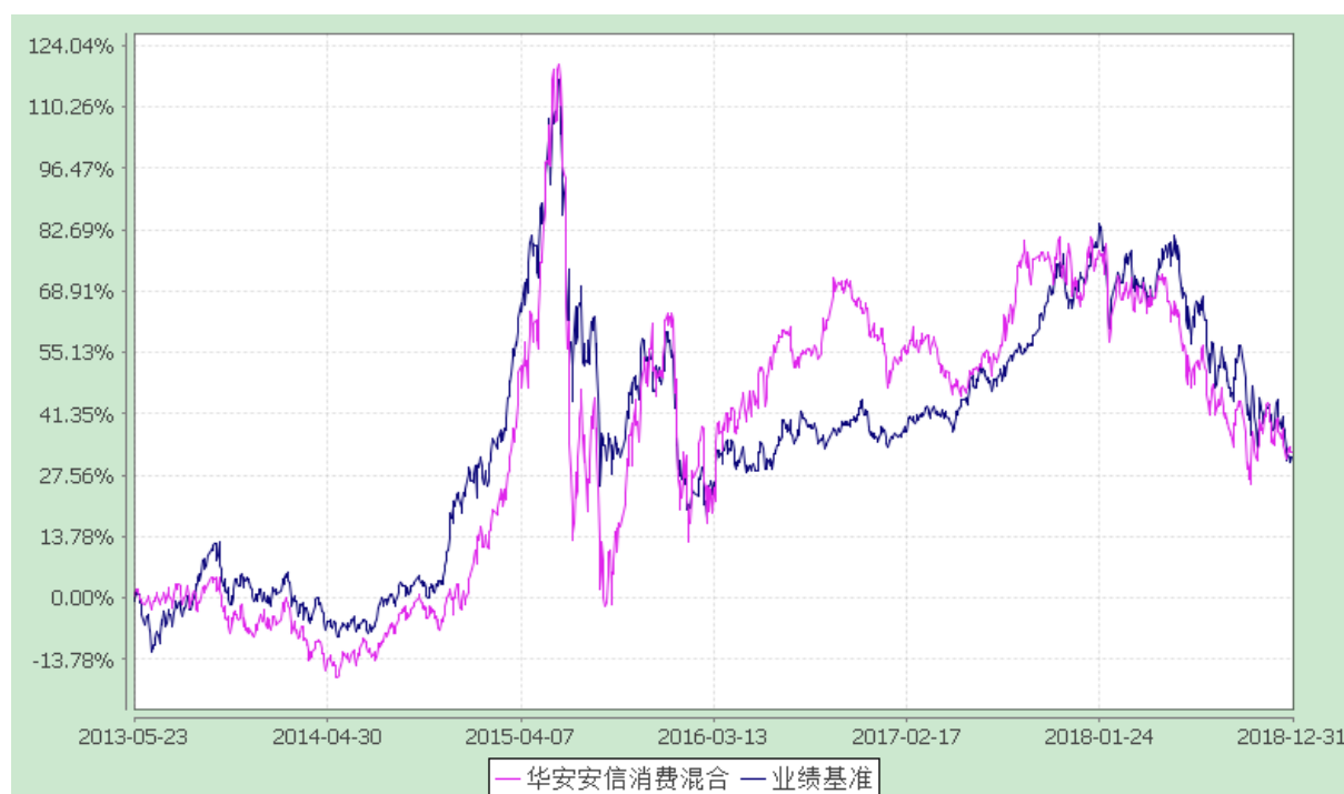
华安安信消费服务混合型证券投资基金 份额累计净值增长率与业绩比较基准收益率的历史走势对比图 (2013 年 5 月 23 日至 2018 年 12 月 31 日)