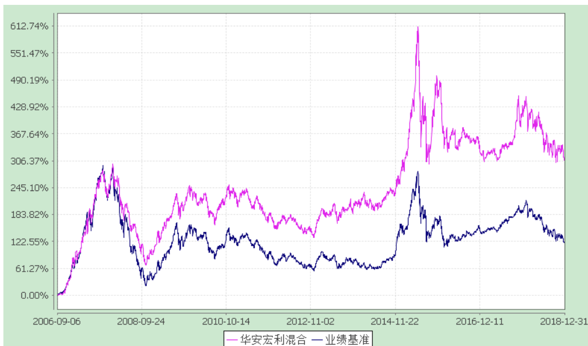
自基金合同生效以来份额累计净值增长率与业绩比较基准收益率的历史走势对比图 (2006 年 9 月 6 日至 2018 年 12 月 31 日)