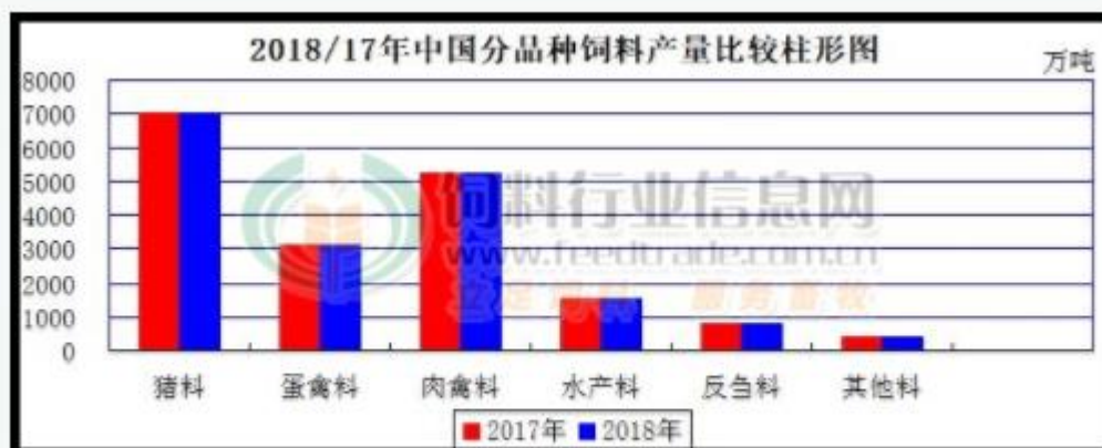
图1 2018年/17年中国分品种饲料产量比较（单位：万吨）

而在与饲料生产对应的养殖市场方面，根据中国饲料行业信息网的统计数据显示，2018年中国生猪养殖出栏量同比增长2.43%，蛋禽（蛋鸡+蛋鸭）平均存栏量同比增长0.06%，肉禽（肉鸡+肉鸭）年度出栏量同比下降0.34%。生猪全价料占比明显下降而预混料占比增加，导致猪料总产量同比增幅明显偏低。