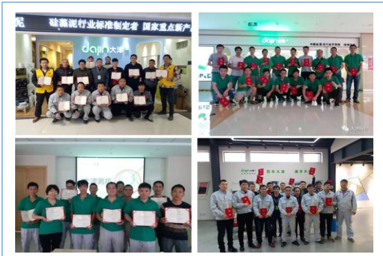
3-6 月硅藻泥施工培训