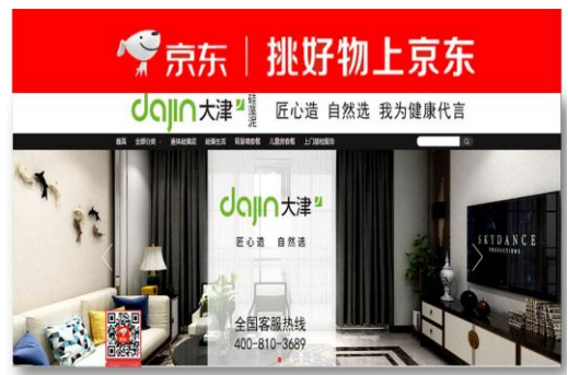
9月京东官方旗舰店上线