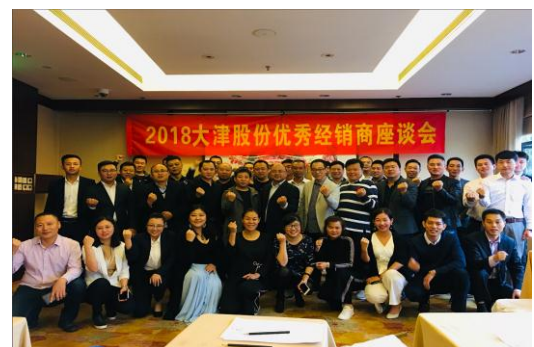
2018年10月 杭州优秀经销商会议