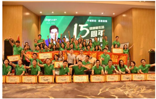
4月-10月全国联动活动