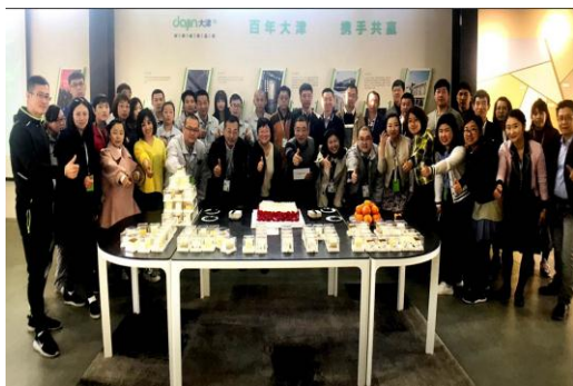
4月11日 天津十五周年司庆