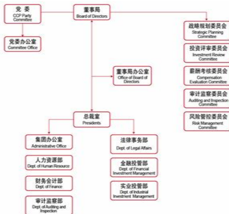
图 3-2：无锡市国联发展（集团）有限公司内部机构设置图