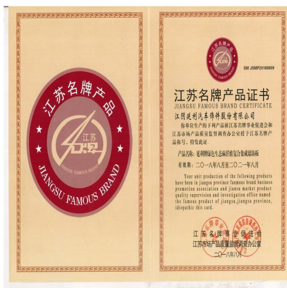
江苏名牌产品证书