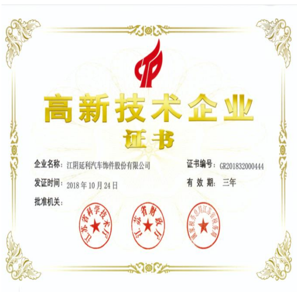
重获高新技术企业三年复审证书