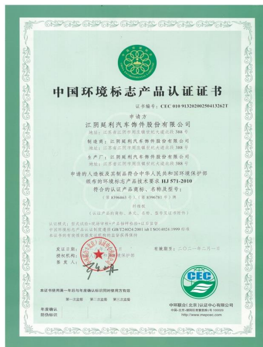
再次获得中国环境标志产品认证证书