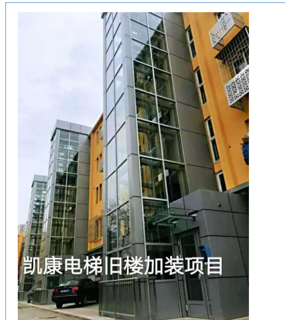
凯康电梯旧楼加装项目

2、2018年4月“创响长治”路演活动，在高新区孵化园举行，长治市发改委、长治高新区领导、以及各众创空间负责人、中小型企业代表、青年创业者、创业大学生参加了此次活动。山西凯康电梯股份有限公司荣获“长治国家高新区优秀创业企业”称号。