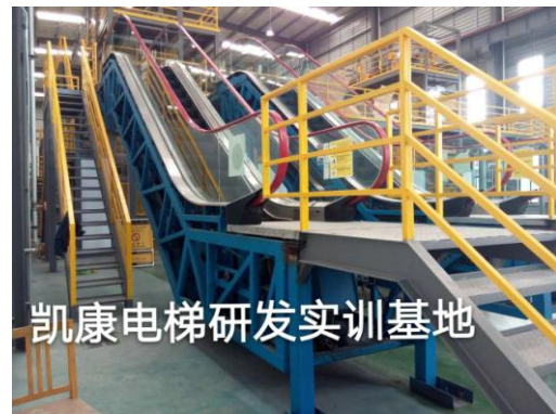
凯康电梯研发实训基地

3、为配合公司战略实施，响应十九大对加装电梯推进工作的重要精神，2018年5月12日，集“电梯维保人员技能培训、考核实训”与“加装电梯技术研发、成果转化、市场化推广生产”为一体的“凯康电梯研发实训基地”在市长杨勤荣、高新区党工委副书记及管委会主任张志刚同志的共同见证下正式落户开工。