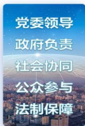
创新社会治理格局

基层社会治理的体制机制创新： 公司通过党政统筹的强化切实推动了部门与部门、部门与社区、党委政府与社会之间的全向型信息共享和工作协同，实现基层社会治理的方式、方法和路径方面的创新，并体现和固化到信息系统中。截止报告期末，公司共取得社会治理领域发明专利26项。