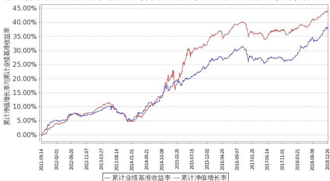
图 2: 嘉实信用债券 C 基金份额累计净值增长率与同期业绩比较基准收益率的历史走势对比