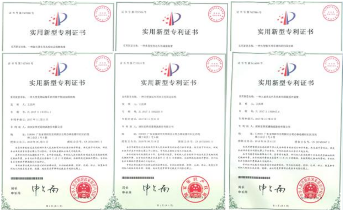
2018 年，公司获得 6 项实用新型专利，公司的技术研发能力稳步提升，增强了市场竞争能力。