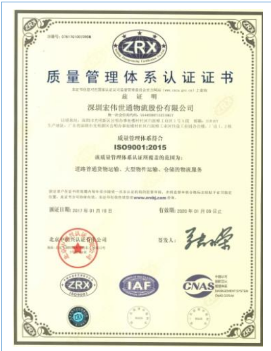
公司于 2018 年 1 月顺利通过了 ISO9001 外部审核工作。