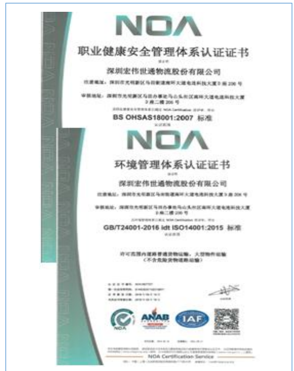
公司于 2018 年 9 月顺利通过了 ISO14001、OHSAS18001 外部审核工作。