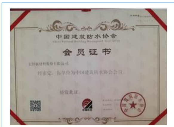
报告期内，公司获得中国建筑防水协会颁发的会员证书，有效时间至2020年03月15日。