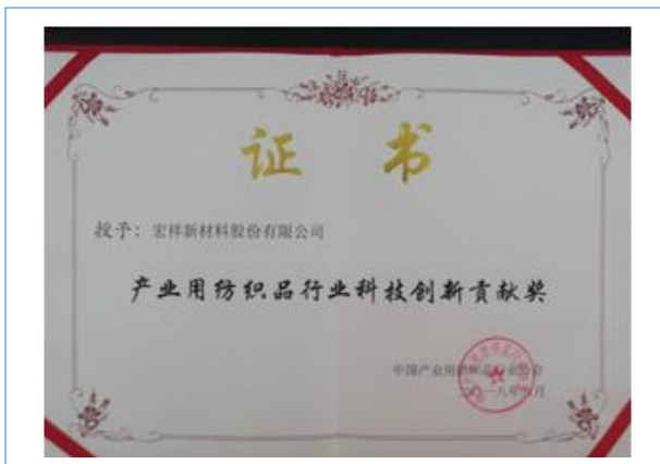
报告期内，公司获得中国产业用纺织品协会授予的“产业用纺织品协会科技创新贡献奖”。