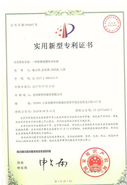
2018年08月，公司“一种阻燃型塑料排水板”获得国家实用新型专利授权。