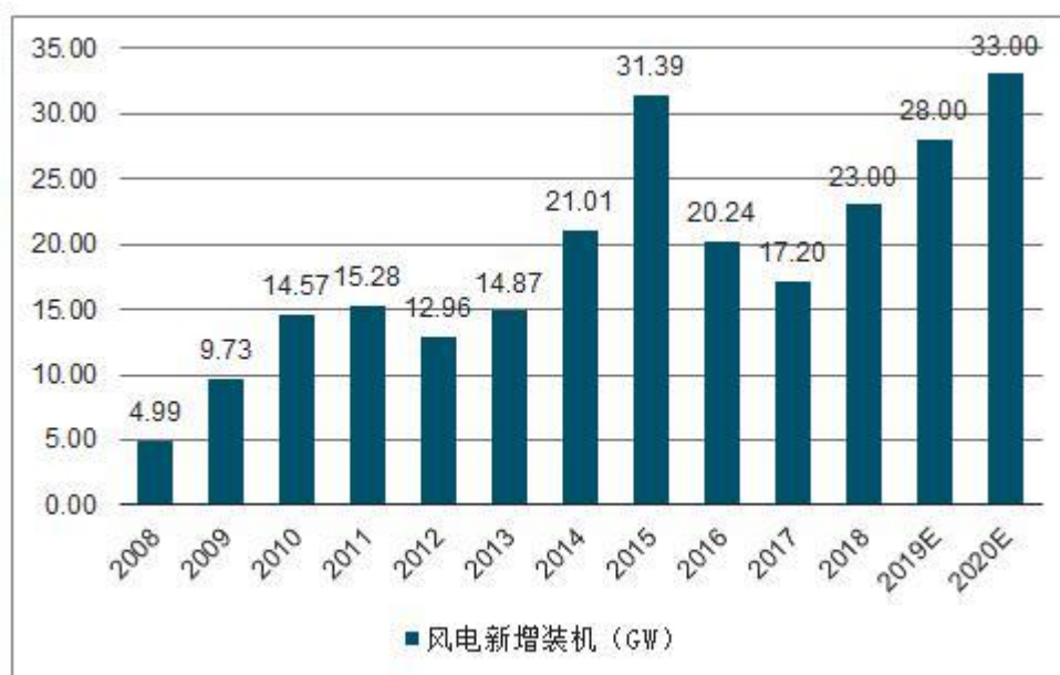
国内风电新增装机统计