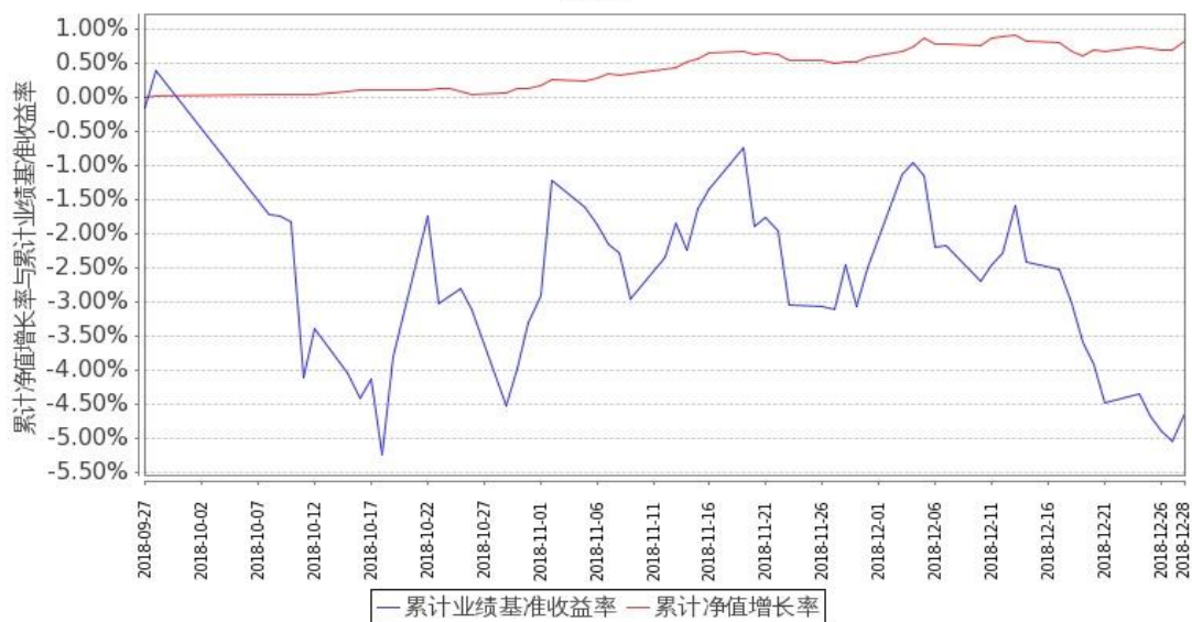
图 1：嘉实新添康定期混合 A 基金累计份额净值增长率与同期业绩比较基准收益率的历史走势对比图 （2018 年 9 月 27 日至 2018 年 12 月 31 日）