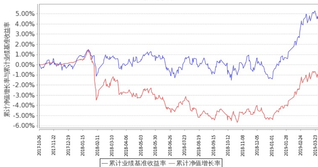
图2：嘉实领航资产配置混合（FOF）C基金累计份额净值增长率与同期业绩比较基准收益率的