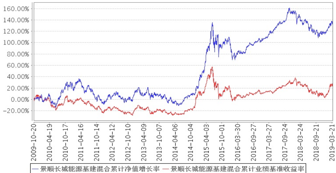
景顺长城能源基建混合累计净值增长率与同期业绩比较基准收益率的历史走势对比图

注：本基金的资产配置比例为：股票投资比例范围为基金资产的60%–95%，持有现金或者到期日在一年以内的政府债券的比例不低于基金资产净值的5%。本基金投资于与能源及基建业务相关的上市公司所发行股票的比例高于基金股票投资的80%。根据基金合同的规定，本基金的建仓期为基金合同生效日