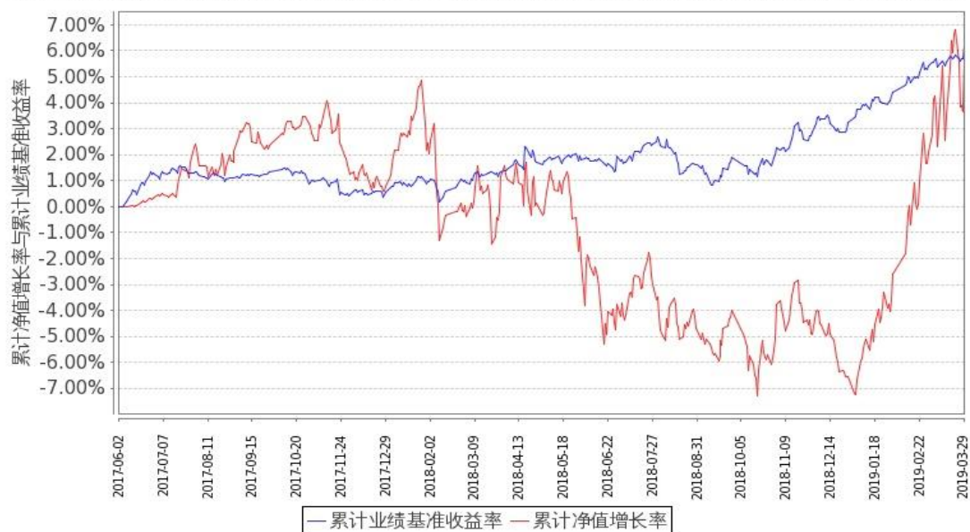
图 1：嘉实稳宏债券 A 基金份额累计净值增长率与同期业绩比较基准收益率的历史走势对比图