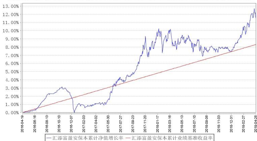
汇添富盈安保本累计净值增长率与同期业绩比较基准收益率的历史走势对比图

注：本基金建仓期为本《基金合同》生效之日（2016 年 4 月 19 日）起 6 个月，建仓期结束时各项资产配置比例符合合同规定。